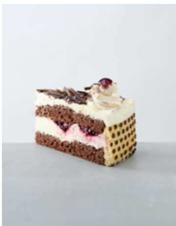
Schwarzwälder Kirschtorte €4,70 (A-C-F-G-H)