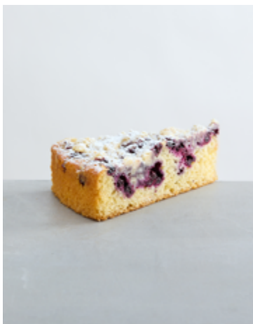
Heidelbeer- Buttermilchtorte €4,70 (A-C-G-H) mit Mandelcrunch