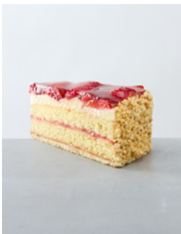
Erdbeertorte €4,70 (A-C-G-H)