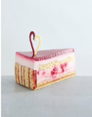
Himbeer- Joghurttorte €5,20 (A-C-F-G-O)